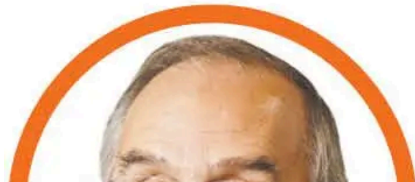
LUÍS MARQUES MENDES