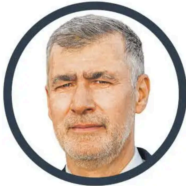
GOUVEIA E MELO