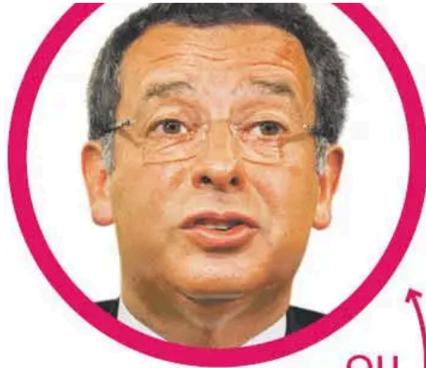
ANTÓNIO JOSÉ SEGURO