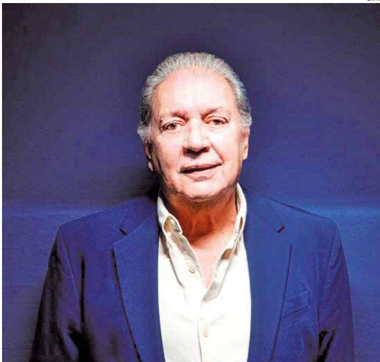
O cantor apresenta dois espetáculos no Auditório Carlos do Carmo

Homenagem a autarcas, música e bolo comemorativo no Auditório.