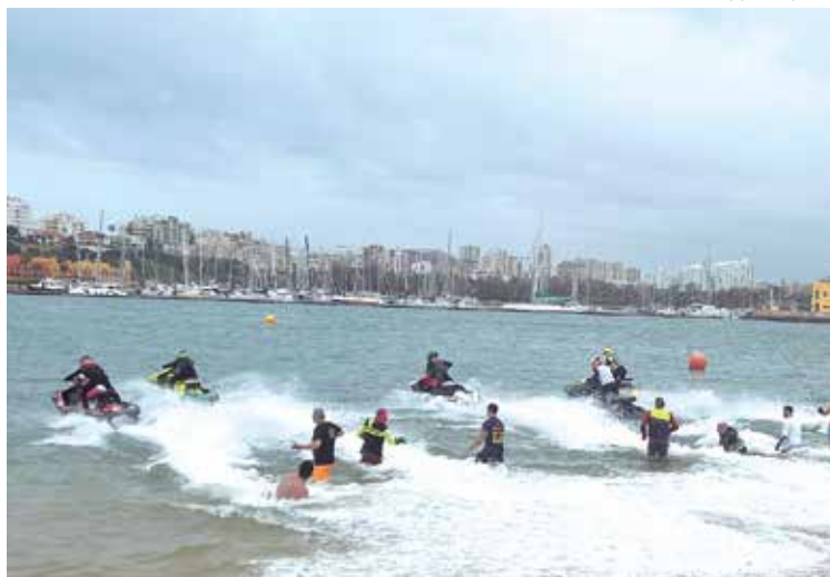
A competição atraiu fãs da modalidade à Praia da Angrinha

e ao sucesso registado, decidimos separar as provas em 2025. Temos já os três dias completos, com participação dos miúdos das escolas dos Agrupamentos ESPAMOL e AERA, e da Nobel e Escola Alemã. Tal como no ano passado, o evento irá contar também